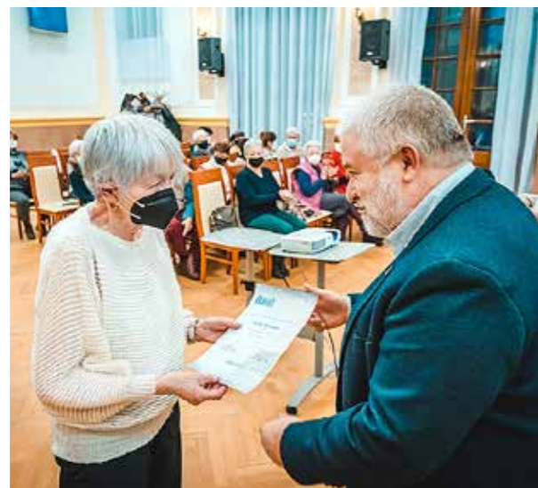
Hatvanöten vehettek át oklevelet