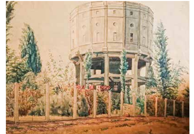
Szabó István Gusztáv akvarellje a víztornyról, 1928, KHGY

Az épület jellegzetes külleme és magassága miatt is kitűnik családi házas környezetéből.