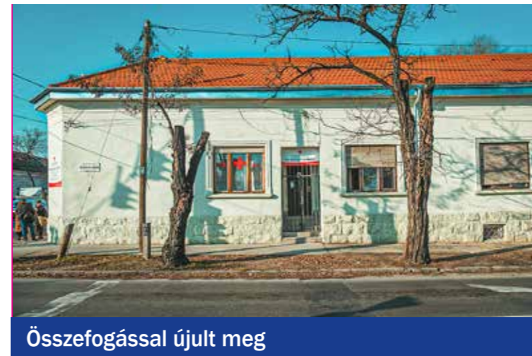
Összefogással újult meg

Az önkormányzat és a Magyar Vöröskereszt Budapesti Szervezete mintegy 43 millió forintból közösen felújította az Ady Endre úti épület tetejét és a belső helyiségeket. 2017-ben a vizesblokk teljes felújításával járult hozzá a zavartalan üzemeltetéshez az önkormányzat. A kispesti szervezet közfeladat-ellátásra, a kerületi hajléktalanok gondozására használja az épületet. A telephelyen 60 fős nappali melegedő, 19 férőhelyes éjjeli menedékhely és 9 fős időszakos éjjeli menedékhely működik, de az intézményben található az utcai szociális munkások, valamint a kerületi szervezet irodája is.