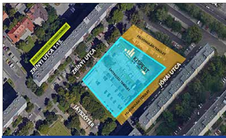
Ingyenes parkolók lesznek

A szakirodától kapott információk szerint a Zrínyi utcai projekt beruházójának szakembereivel folytatott közös előkészítés és egyeztetés eredményeként a tervek alapján két ütemben 71 új, ingyenes parkolóhely létesül.