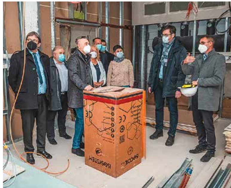
Tavasszal már műtenek itt

Minden a tervek szerint halad, így februárra elkészül az egynapos sebészet a Kispesti Egészségügyi Intézet harmadik emeletén. Márciusban már műtéteket is folytathatnak „kis kórházban” – hangzott el azon az intézménylátogatáson, amelyen a főpolgármesternek mutatták meg a készülő beruházást.