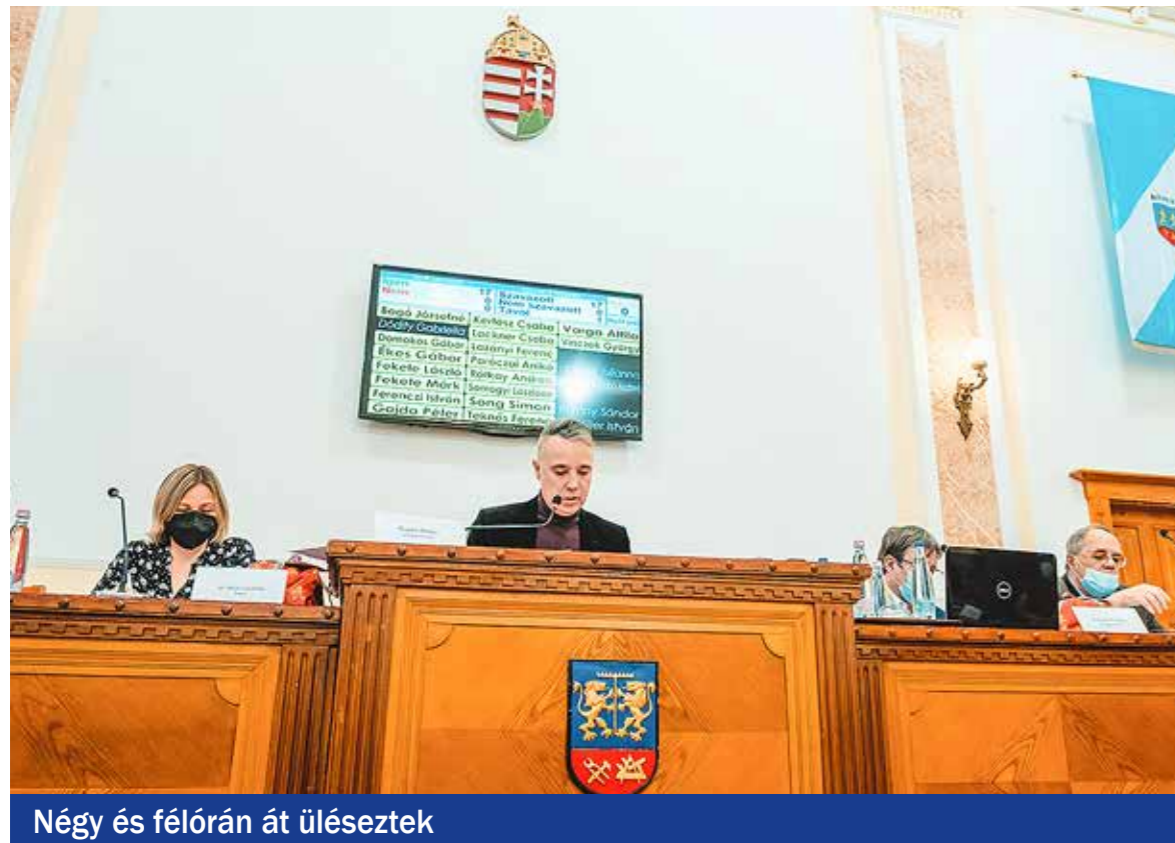
Négy és félórán át üléseztek

Többek között a települési támogatás egyszerűsített igényléséről és megállapításáról, a gyermek- és felnőtt háziiorvosi körzetek módosításáról, a megemelt gyermekszületési támogatásról és a gyermekétkeztetés új támogatási rendszeréről döntöttek a képviselők az év utolsó testületi ülésén.