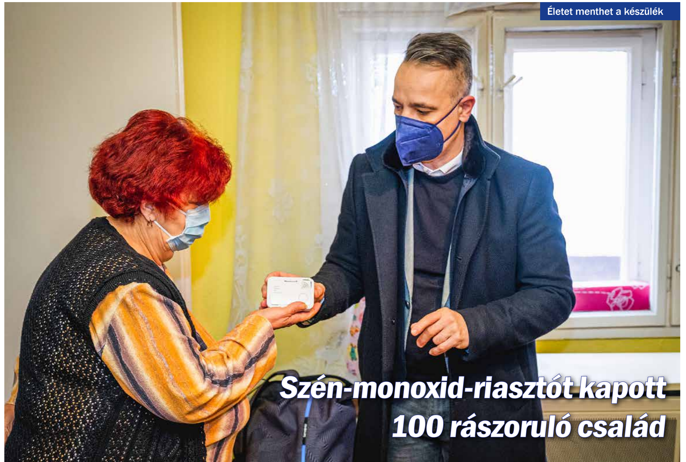
Életet menthet a készülék