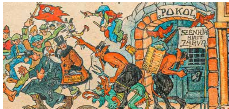
„A tekintélyvel messze elkerüli”

A békéscsabai Munkácsy Mihály Megyei Múzeum és a Kispesti Helytörténeti Gyűjtemény kiállítása január 30-ig tekinthető meg a Nagy Balogh János Kiállítóteremben.