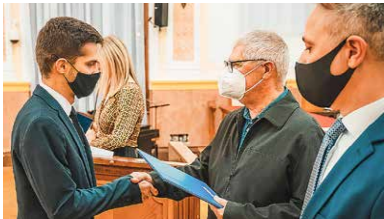
Támogatás a jövőnek