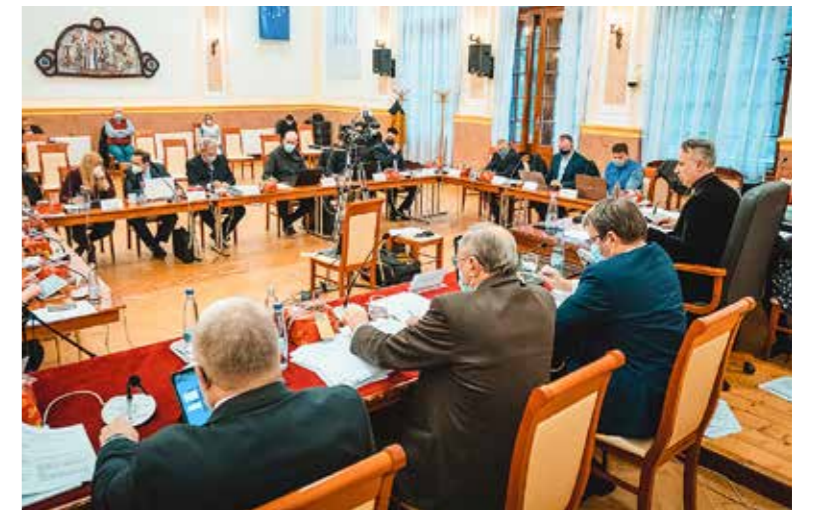
Tíz rendeletet alkotott a testület

Heti 6 órában a sebészeti szakorvosok órák terhére gyermekorvosi szakrendelés indulhat a Kispesti Egészségügyi Intézetben (KEI). Ez a szakrendelés, mely a kerületi csípőszűrést is végezte, szakemberhiány miatt