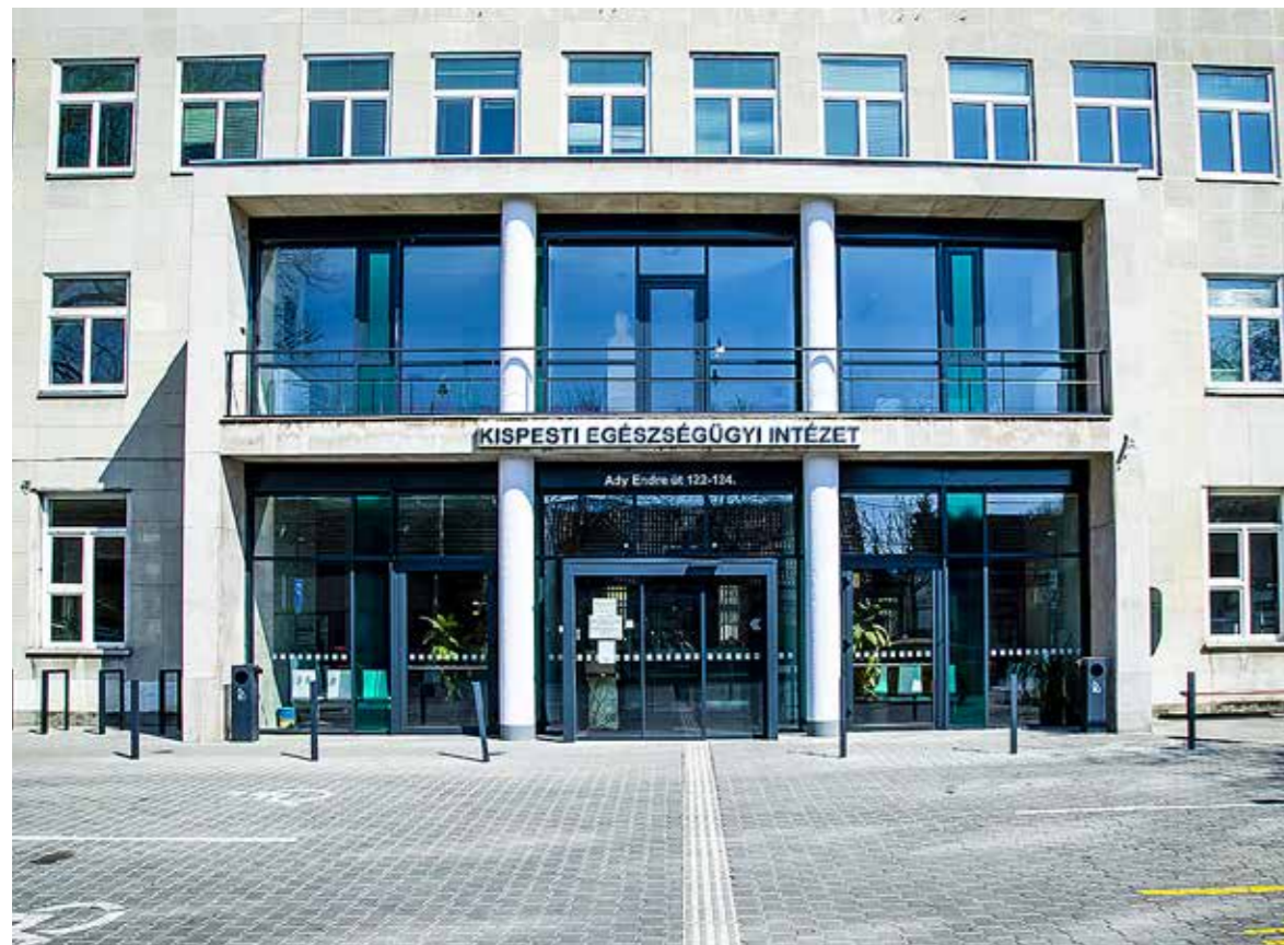
Aktuális információk az euint.kispest.hu honlapon

A járványügyi helyzet kedvező alakulása – köszönhetően az országos, kerületi és intézeti szintű, időben meghozott intézkedéseknek és a kispestiek fegyelmezett együttműködésének – engedi utolsó lépcsőként időkorlátozás nélkül, teljes üzemmódban és szakmai profillal a rendelkezésre állást a Kispesti Egészségügyi Intézetben.