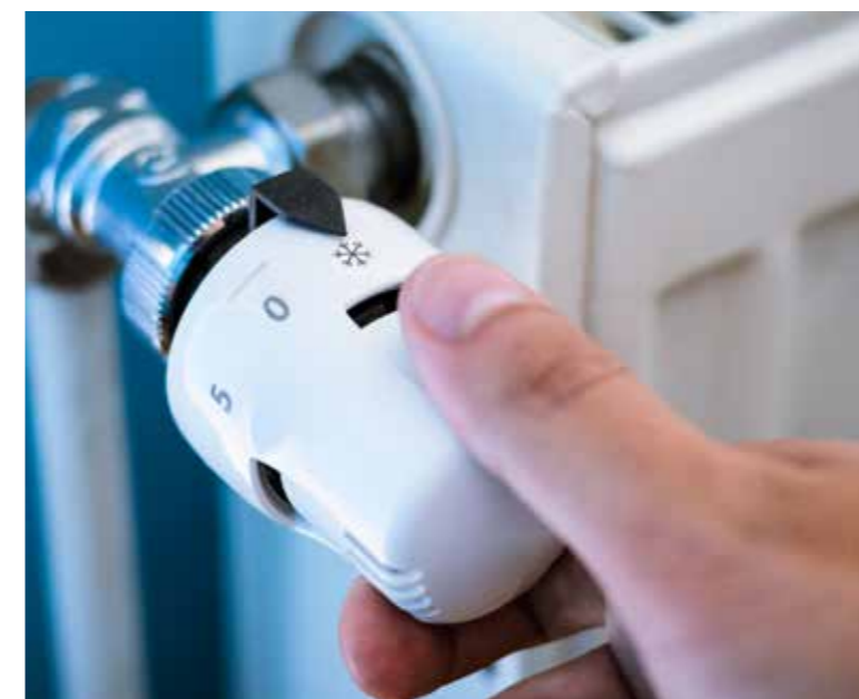
Júliustól igényelhető a lakásrezi-támogatás

körével. A jogosultság feltétele a védendő gáz- vagy áramfogyasztói nyilvántartásba vétel vagy annak kezdeményezése. A támogatás a távfűtési fogyasztók esetében a távfűtési, egyéb esetben a víz-, csatorna- és szemétszállítási díjat csökkenti havi 2000 forinttal. A nem távfűtő fogyasztók esetében a díjkompenzáció 2000 forintos összege a következőképpen áll össze: a vízdíj és a csatornadíj 750-750 forinttal, a szemétdíj 500 forinttal csökken. A támogatásra egy lakásban egy ember jogosult. A jogosultság megállapítását, a támogatás folyósítását a HÁLÓZAT – A Díjfizetőkért és Díjhátralékosokért Alapítvány végzi a Díjbeszedő Holding Zrt.-vel együttműködve. Nyomtatványok letölthetők a kiscest.hu honlapról, személyesen igényelhetők és leadhatók a Polgármesteri Hivatal Humánszolgáltatási és Szociális Irodáján.