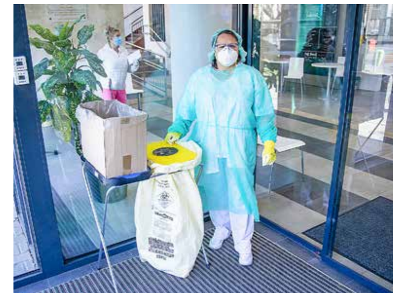
Érvényben maradnak a biztonsági intézkedések

Az Országgyűlés döntése értelmében a veszélyhelyzet megszűnését követően is – időkorlát nélkül – megmarad az e-receptek egyszerűsített kiváltási módja, amelyhez a beteg taj-számának megadása mellett a kiváltó személyazonosságának hitelt érdemlő igazolására van szükség – közölte az Emberi Erőforrások Minisztériuma. Megmarad a telemedicinális ellátások lehetőségét is, így az ellátás sajátosságait és orvosszakmai indokoltságát figyelembe véve továbbra is lehet a beteg távollétében előszűrést végezni, diagnózist vagy terápiás javaslatot felállítani, távmonitoringot folytatni, gyógyszert rendelni, vagy védőnői gondozást ellátni távmonitoring eszközökkel és egyéb infokommunikációs technológiák révén hozzáférhető információk alapján.