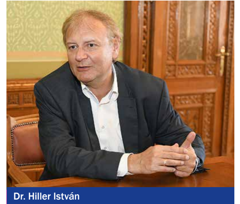
Dr. Hiller István

sen vásárolni, még a környező kerületekből is. Sajnálatos módon azonban a piac épületei és infrastruktúrája elöregedett az elmúlt évtizedekben, a korszerűsítés pedig a terület egy-éves költségvetésének mintegy húsz százalékát emésztene fel, amit az önkormányzat nem tud önerőből kigazdálkodni. Burány Sándor javasolja a Kispesti Szociális Lakásprogram elindításának másfél milliárd forint támogatását is. A kért támogatásból az önkormányzat növelni tudná szociális- és krízislakás-állományát új ingatlanok építésével és vásárlásával, ezáltal méltó lakhatást biztosítva a legrászorultabbaknak. Dr. Hiller István, az Országgyűlés alelnöke az elavult wekerletelepi vízvezeték-hálózat felújítására kér egymilliárd forint állami támogatást, valamint a Zoltán utcai sporttelep fejlesztésére 50 milliót, illetve a Jahn Ferenc Dél-Pesti Kórház és Rendelőintézet felújítására 3,2 milliárd