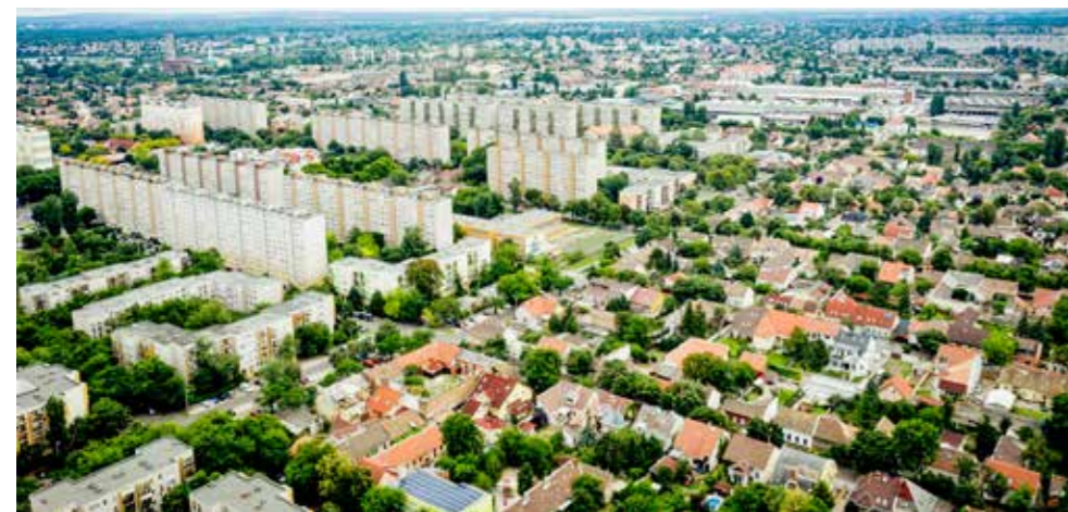
Elmaradhatnak a tervezett fejlesztések

alapba. Az akkor átmenetinek gondolt elvonás a jövő évi költségvetés szerint állandósulna. Bár az utakat az önkormányzatoknak kell fenntartani, a gépjárműadókból semmit nem tarthatnak meg a kerületek. A gépjárműadó tervezett elvonásával az önkormányzatokat közel 87 milliárd forinttal sújtja a magyar állam. Szintén az önkormányzatokat sújtja az úgynevezett szolidaritási hoz-