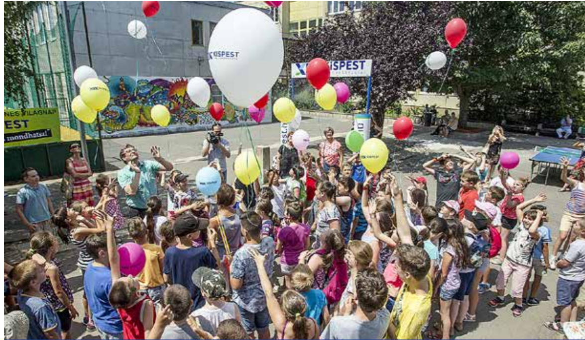
Idén is izgalmas programok várják a gyerekeket

Az önkormányzat június 29-től augusztus 19-ig szervezi meg hagyományos, térítésmentes napközis táborát a kispesti gyerekeknek az Eötvös iskolában, míg a Kispesti Szociális Szolgáltató Centrum el látottjait minden hónap első hetében várják egyhetes táborozásra.