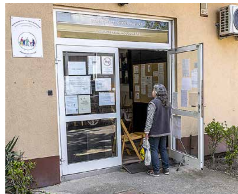
Adományosztás a szociális centrumban

kell a munkáltató igazolását a munkanélkülivé válásról, illetve a munkáltató által kezdeményezett fizetetlen szabadság elrendeléséről (minimum két hét), a 2020. március 15-e utáni időszakra vonatkozóan. Szükséges a regisztrált álláskeresési igazolás vagy határozat a foglalkoztatási osztálytól. Kérelemnyomtatvány letölthető az uj.kiscest.hu honlapján.