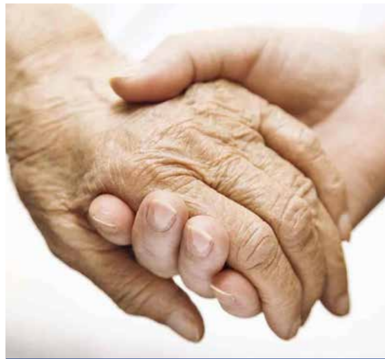
Többféle települési támogatás igényelhető

A létfenntartási gondokkal küzdő kiscestiek rendkívüli települési támogatást és lakásrezi-támogatást igényelhetnek. Sok család mindennapjain segítenek a Kiscesti Szociális Szolgáltató Centrum munkatársai, a nehéz anyagi körülmények között élőknek a Kiscesti Rászorultak Megsegítésére Közalapítvány is igyekszik segítséget nyújtani. A munkájukat elveszítők a kormányhivatal foglalkoztatási osztályán igényelhetnek álláskeresési járadékot.