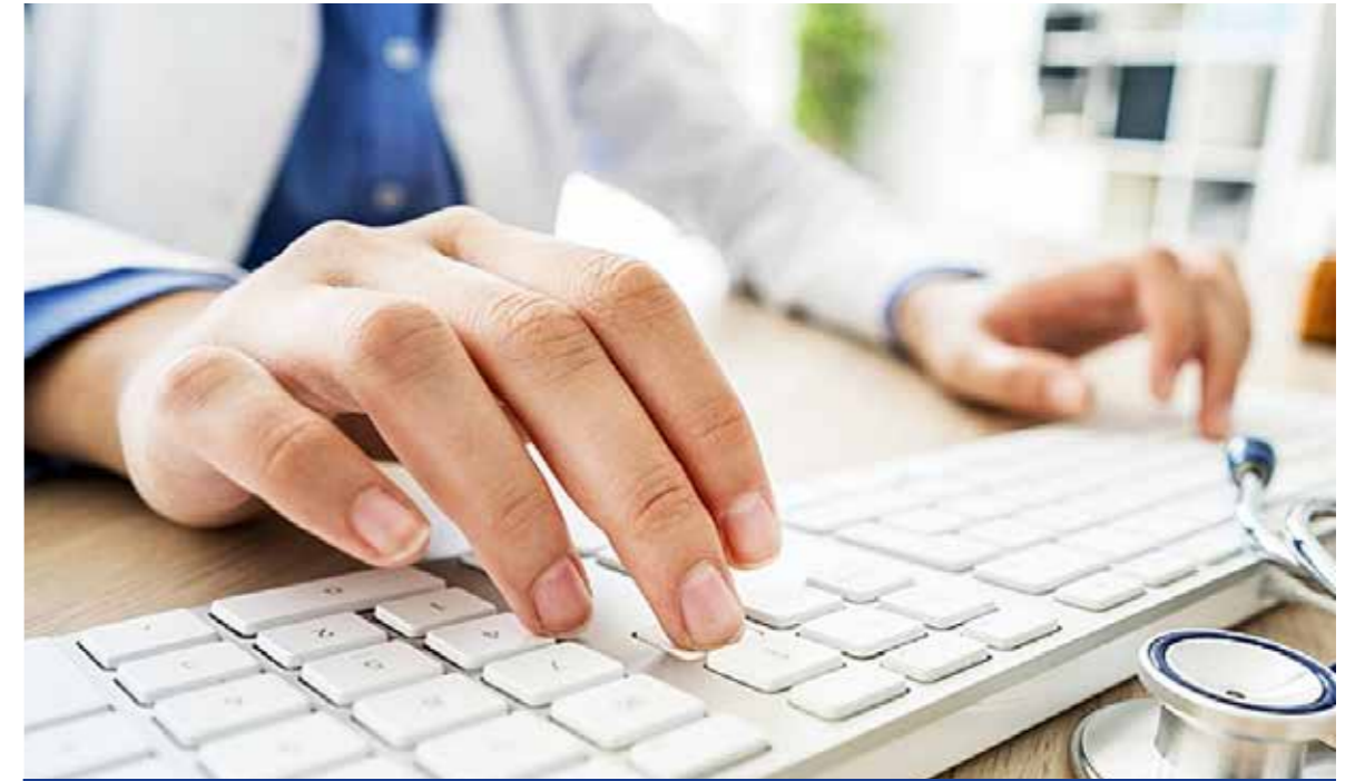
Egyszerűen kiválthatók az elektronikus receptek

Újraindultak a személyes szociális szolgáltatások a Kispesti