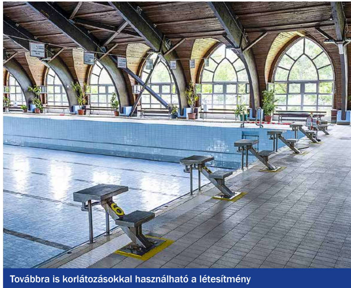
Továbbra is korlátozásokkal használható a létesítmény

A hosszúra nyúlt kényszerű zárás után június közepén részlegesen kinyitott a Kispesti Uszoda, és már a belső medencéket is lehet használni.