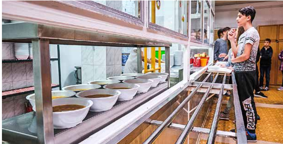
Lejárt a „bödönös” közétkeztetés ideje?

Közbeszerzési pályázatot írt ki az önkormányzat a kerület óvodai, iskolai és szociális intézményi közétkeztetésére. A pályázatra hárman jelentkeztek, a jelenlegi szolgáltató nem indult. Az úgynevezett „bödönös”, újramelegítő konyhák kora lejárt, a változás az egészségügyi gyakorlatból érkezik.