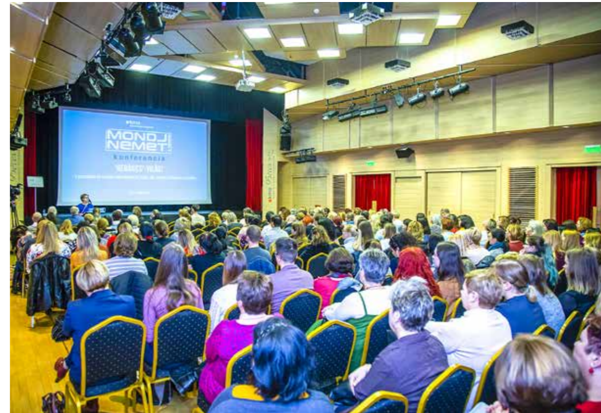
Idén a családon belüli bántalmazás került fókuszba

A gyermekeket ért családon belüli bántalmazás felismerése és kezelése volt a témája a „Nebáncs-világ!” mottóval megrendezett 22. Mondj nemet! konferenciának a KMO Művelődési Központban.