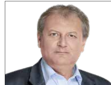
DR. HILLER ISTVÁN országgyűlési képviselő (MSZP)

Következő fogadóóráját 2019. december 12-én, csütörtökön 17 órától tartja a kispesti MSZP-irodában (XIX., Kossuth Lajos utca 50.). Előzetes bejelentkezés nem szükséges