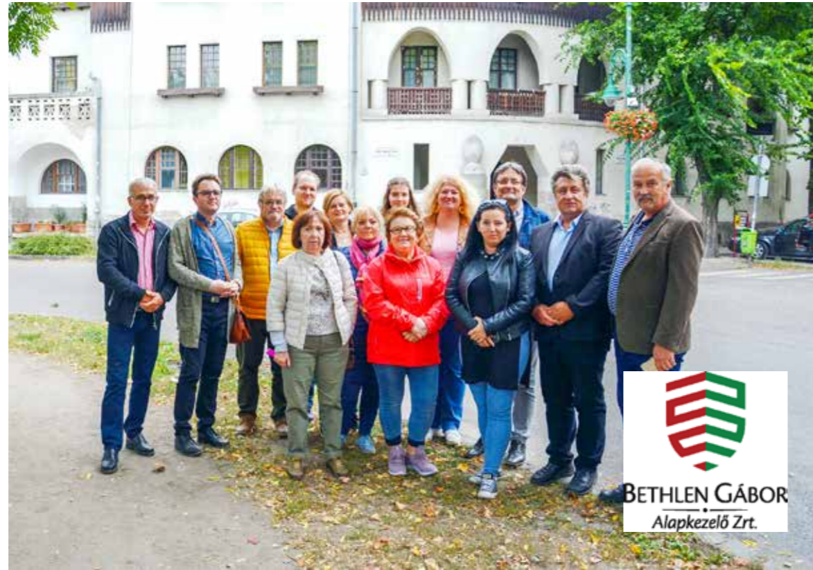
Kispest legújabb testvérvárosából érkezett a delegáció

A „Kispest és Tasnád testvérvárosi kapcsolatának fejlesztése oktatási és nevelési programokon keresztül” című pályázati program a Bethlen Gábor Alapkezelő Zrt. 1, 7 millió forintos támogatásából valósult meg.