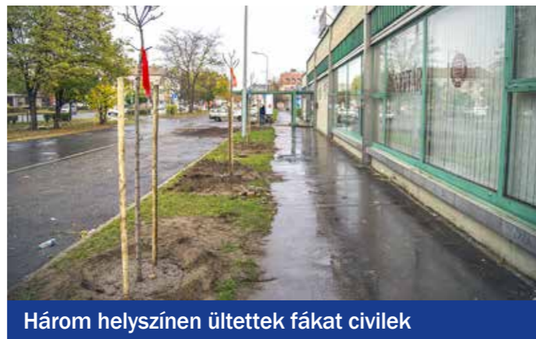
Három helyszínen ültettek fákat civilek

helyszín – az Üllői úti könyvtár előtti fűsáv, a József Attila utcai játszótér környéke és a Zrínyi utca egy szakasza – a 22 facsemetével. A Zöldprogram Iroda és a Közpark Kft. szakmai tanácsokkal, komposztfölddel és szerszámokkal támogatta az akciót, az Átalakuló Wekerle közösség, az 1. sz. Rákóczi Lakásfenntartó Szövetkezet, valamint a Richter Gedeon Nyrt. 1. sz. óvodájának szülői munkaközössége is segítette a helyi szervezetnek.