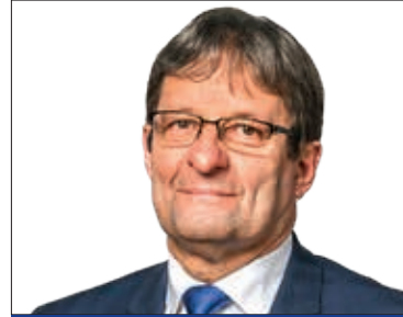
VINCZEK GYÖRGY alpolgármester (MSZP-DK-Együtt-PM)

12. sz. választókerület Alpolgármesteri fogadóórája: Minden hónap második szerdáján 13.00–16.00 óra között, telefonos egyeztetés alapján (347-4523) Polgármesteri Hivatal, Városház tér 18-20. Képviselői fogadóórája: Minden hónap harmadik hétfőjén 17.00–18.00 óra között Kertvárosi Közösségi Ház (Temesvár u. 117.)