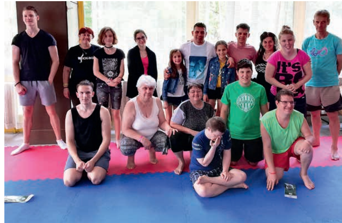
Edzőtáborban a kispesti fiatalok

Értelmükben akadályozott felnőtteknek és hozzátartozóiknak segít a szabadidő hasznos eltöltésében a Kispesten működő ÉNO Gyöngyszemek Alapítvány, amely az elmúlt hónapokban is tartalmas programokat szervezett a gondozottaknak.