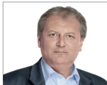
DR. HILLER ISTVÁN országgyűlési képviselő (MSZP)

Következő fogadóóráját 2019. szeptember 12-én, csütörtökön 17 órától tartja a kispesti MSZP-irodában (XIX., Kossuth Lajos utca 50.). Előzetes bejelentkezés nem szükséges