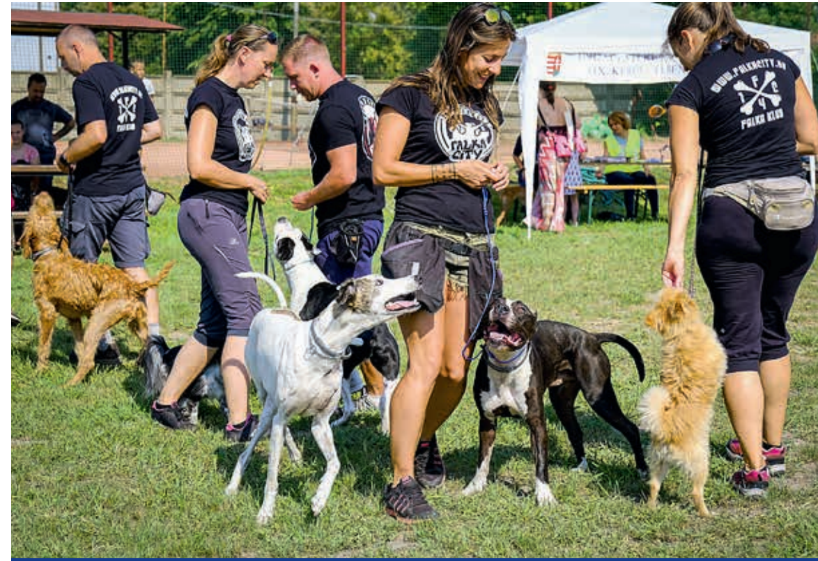
Ötödik alkalommal rendezték meg az EbFesztet

Az ötödik EbFesztet rendezte meg a Kispesti Állatvédelmi Járőrszolgálat és az önkormányzat a Katona József utcai Tichy Lajos Sportcentrumban. Gajda Péter polgármester, illetve Rátkay Andrea, Vinczek György és Kertész Csaba alpolgármesterek is meglátogatták az egyre népszerűbb rendezvényt.