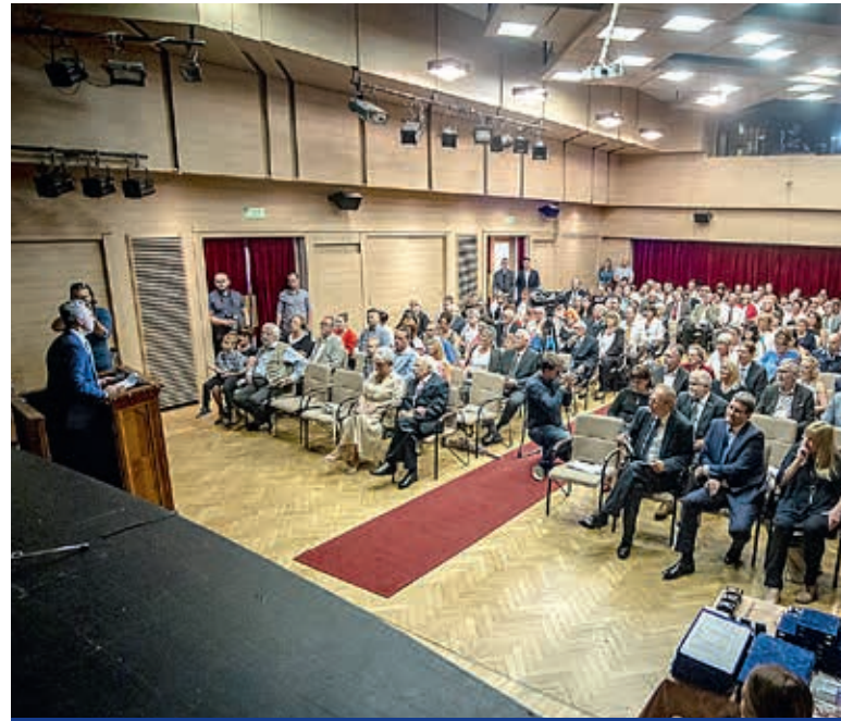
Ünnepi képviselő-testületi ülés a KMO-ban

Kispest Önkormányzata számos különböző díjjal, jutalommal, emléklappal és oklevéllel ismeri el az itt élő, illetve a kerülethez kötődő szakembereket és civileket, akik – a nevelés, az oktatás, a kultúra, a szociális gondoskodás, az egészségügy, a környezetvédelem, a közbiztonság vagy a sport területén – hozzájárulnak szűkebb közösségük megbecsüléséhez, Kispest fejlődéséhez.