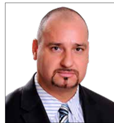
Lázár Tamás (Jobbik)

el is ment az ülésre, azonban távolmaradt a teljes kormány és az összes kormánypárti képviselő. Üléseiket üresen, a több százezer érintett magyar család az út szélén hagyták. Szégyen! Mindeközben Orbán a diplomáciával tölti napjait, bár nincs sok szerencséje. A szélsőjobb, sőt újfasiszta politikusokkal rokonszenvező kormányfő nemrég ezt mondta: „Én azt javaslom Európának, ami Ausztriában történik. Európának át kellene vennie az osztrák modellt.” Hát az osztrák modellt most az, hogy a szélsőjobb alkancellár belebukott egy korrupciós botrányba, és előrehozott választások lesznek. A szélsőjobbra toló Orbánnak ez az út vége.