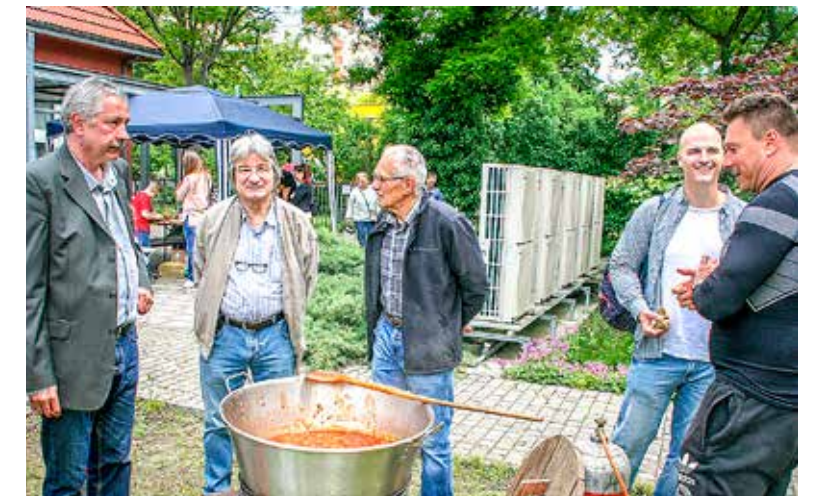
Nyolc csapat bográcsában főtt az étel