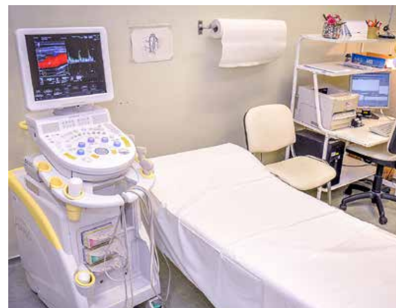
Felső kategóriás ultrahangkészülék az intézetben

alkalmas a hasi szervek és a kismedence, az artériák, vénák és nyaki erek, valamint a lágy részek és az ízületek vizsgálatára – 31 millió forintos saját forrásból szerezte be az intézmény. A 2014-ben szintén önerőből, mintegy 60 millió forintért vásárolt röntgengépet az Ady Endre úti szakrendelőben helyezték