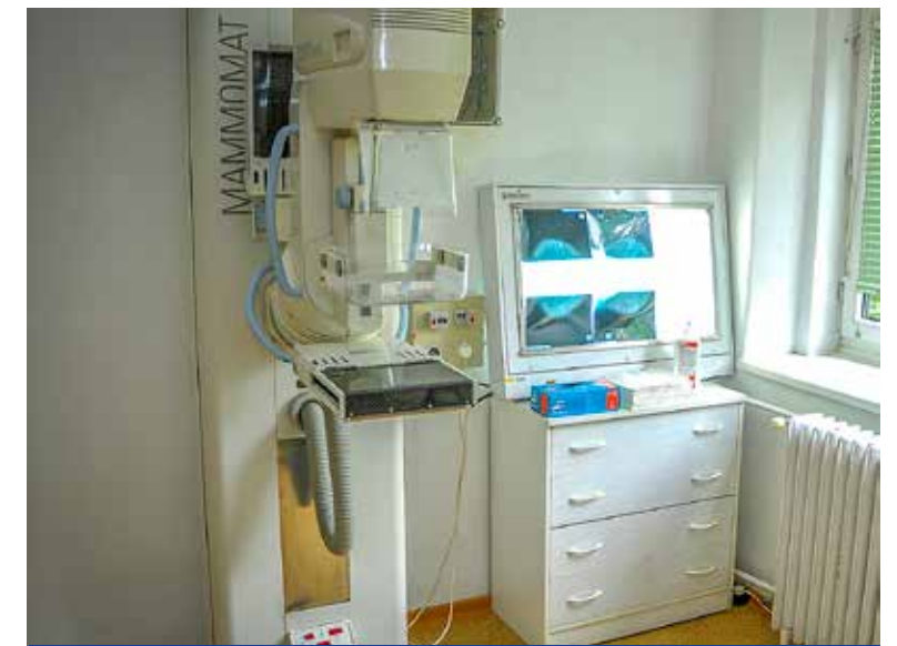
Modern digitális röntgengép a szakrendelőben

szeretnék megvalósítani a webes előjegyzést, vagyis az alapellátó és szakorvosok, továbbá a betegek számára is lehetővé tenni az online előjegyzést.