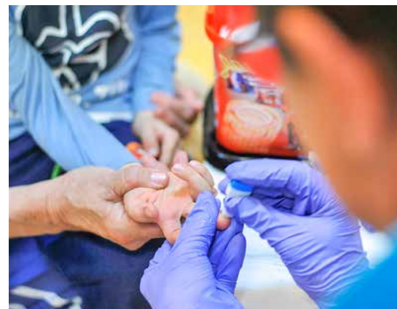
Lisztérzékenység-szűrés a kispesztii óvodákban

terápia, elhasználódott eszközöket pótoltak. Önkormányzati támogatással kerülhetett sor a kardiológia eszközeinek cseréjére és a Holter-rendszer megvásárlására. Az intézet 2018-ban 34 millió forint önkormányzati támogatást fordított informatikai fejlesztésre, kézi műszerek cseréjére, festésre, liftek felújítására. A közelmúltban újabb fontos eszközökkel, fogászati panoráma-röntgennel bővült a szakrendelő eszközparkja, és megtörtént a tüdőgondozóban a meglévő röntgengép direkt digitalizálása. Idén nyáron 160 millió forintos önkormányzati támogatásból teljesen felújítják az épület földszinti betegfogadó terét, ezt követően folytatódhat az informatikai rendszer fejlesztése is. Ennek részeként