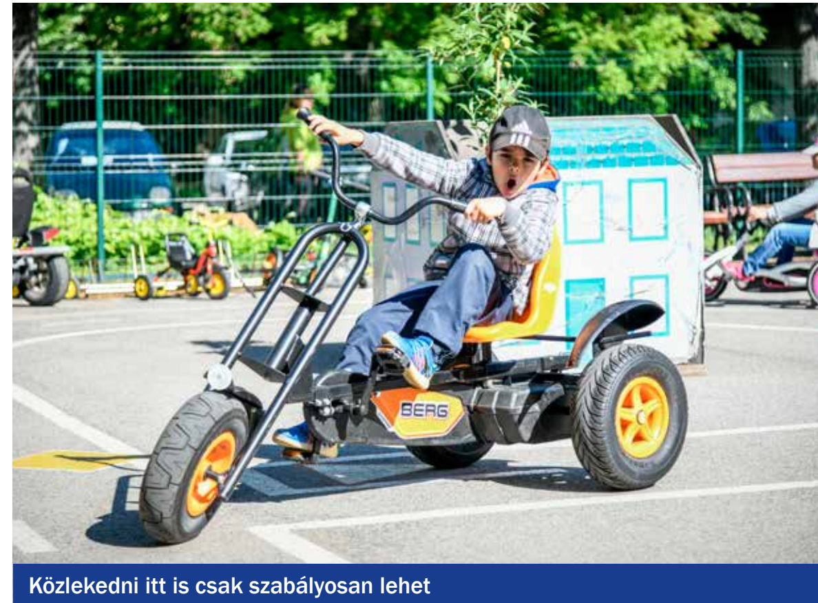
Közlekedni itt is csak szabályosan lehet

Megindult a forgalom a József Attila utca és Hunyadi utca sarkán lévő Kisgyermek Kerékpáros Parkban, ahol mostantól hetente háromszor egész nap működnek a közlekedési lámpák.