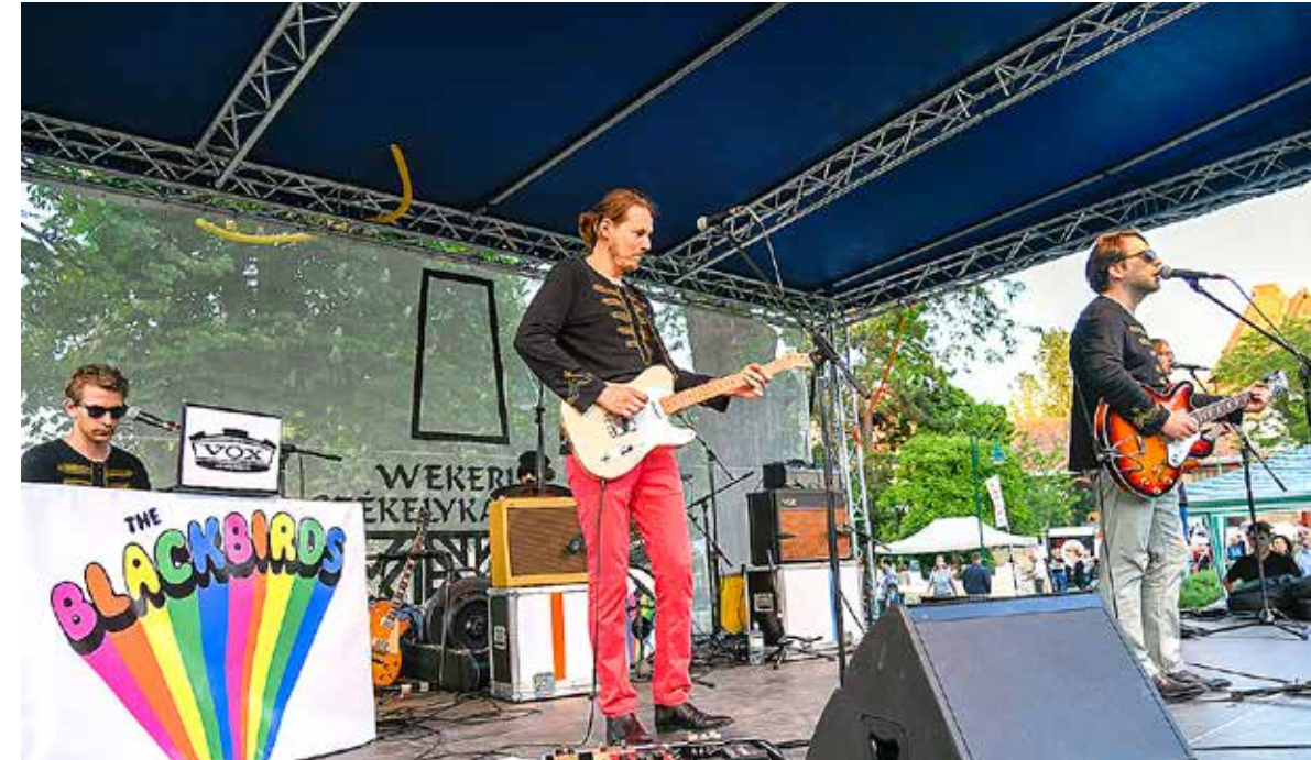
Második este a The BlackBirds adott koncertet

Wekerletelep tavaszi nagyrendezvényét, a Wekerlei Székelykapu Napokat 15. alkalommal rendezte meg május harmadik hétvégéjén a Magyar Kollégium Kulturális Egyesület, a Wekerlei Futóklub és a Wekerlei Társaskör Egyesület, együttműködve a Wekerlei Kultúrházzal.