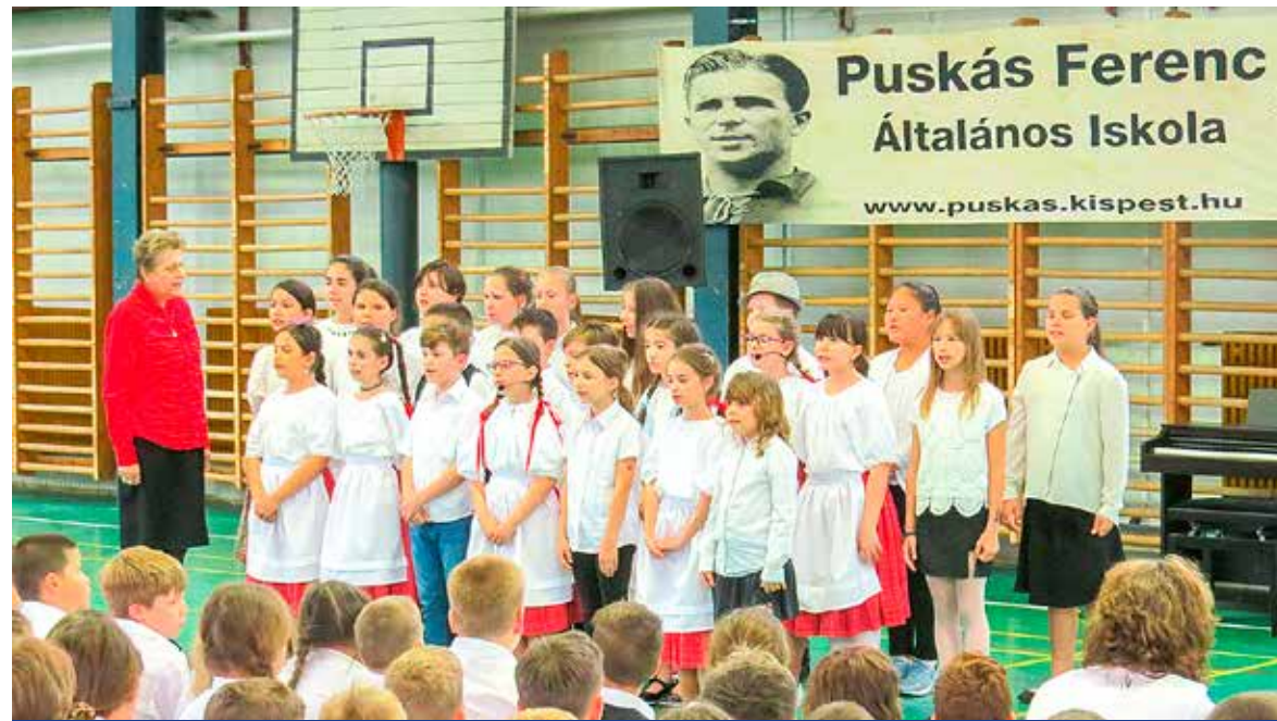
Az iskola énekara a jubileumi gálaműsoron

Fennállásának 40. évfordulóját ünnepli a Kispesti Puskás Ferenc Általános Iskola. Az ünnepi programsorozat zárásaként rendezett gálaműsoron diákok, tanítók és tanárok, szülők, vendégek, egykori tanulók és pedagógusok vettek részt.