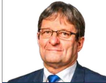
VINCZEK GYÖRGY alpolgármester (MSZP-DK-Együtt-PM)

12. sz. választókerület Alpolgármesteri fogadóórája: Minden hónap második szerdáján 13.00–16.00 óra között, telefonos egyeztetés alapján (347-4523) Polgármesteri Hivatal, Városház tér 18-20. Képviselői fogadóórája: Minden hónap harmadik hétfőjén 17.00–18.00 óra között Kertvárosi Közösségi Ház (Temesvár u. 117.)