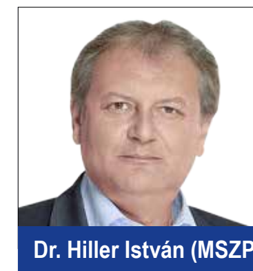
Dr. Hiller István (MSZP)

el ennyire az oktatás-nevelési intézményeket. A kispesti bölcsődék, óvodák és iskolák ugyanis szinte kivétel nélkül felújításra szorulnak, ezt a legutóbbi műszaki vizsgálat is megerősítette. A Jobbik képviselőjeként régóta szorgalmazom az elmaradt fejlesztéseket, így természetesen támogatom a források felhasználását, azt viszont nem értem, hogy miért kell erre másfél milliárd forintot elkölteni, amikor a felújítási költségek az önkormányzat korábbi számításai szerint egymilliárd forintba kerülnek. Főleg úgy, hogy az iskolák már sajnálatos módon kikerültek az önkormányzat fenntartásából.