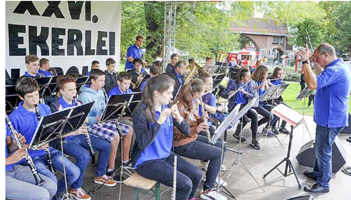
Fúvószenekari koncerttel kezdődött a program

Huszonhatodik alkalommal rendezte meg a telep őszi kulturális fesztiválját az önkormányzat és más partnerek támogatásával, önkéntesek segítségével a Wekerlei Társaskör Egyesület szeptember harmadik hétféjén.