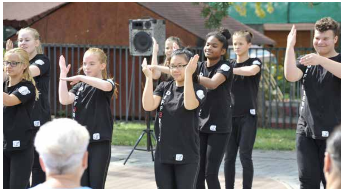
Az Etude táncosai a lelki egészségnapon