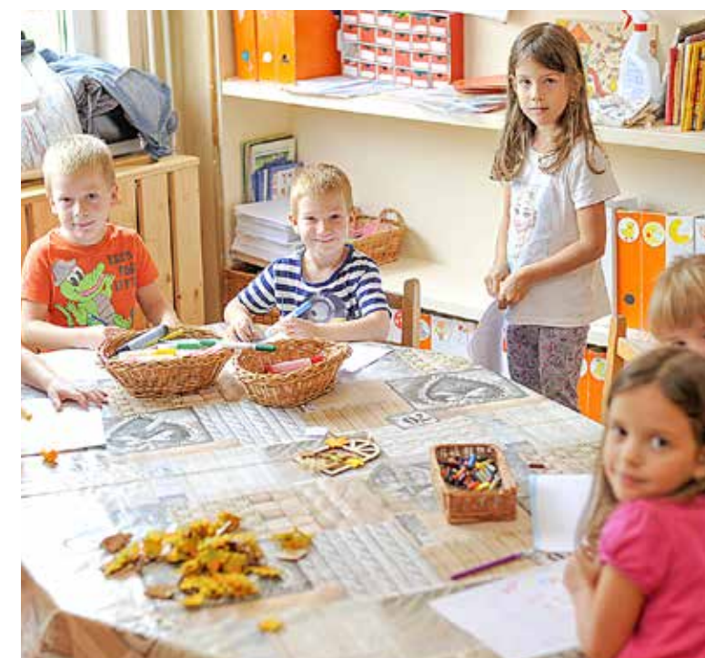
Megújult óvodába térhettek vissza a gyerekek

A nyári szünet után már a Kispesti Mézeskalács Művészeti Modell Óvoda megszépült Kelet utcai tagintézményébe térhettek vissza a kertvárosi óvodások.