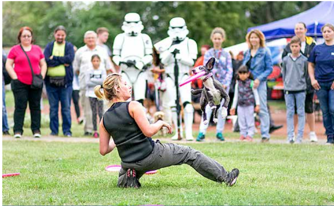
Látványos bemutató nem mindennapi közönség előtt