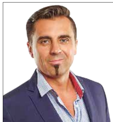
Kránitz Krisztián (MSZP-DK-Együtt-PM)

A kormány hozzájárult ahhoz, hogy Kispest egymilliárd forintos fejlesztési hitelt vegyen fel, amely lehetővé teszi majd, hogy az önkormányzati intézményekben, óvodákban, bölcsődékben ne maradjanak el a legfontosabb felújítások, fejlesztések, így évente 500-500 millió forintot költhet majd a kerület erre. Ön szerint hogyan, mire lehet a legcélszerűbben felhasználni a rendelkezésre álló forrást?