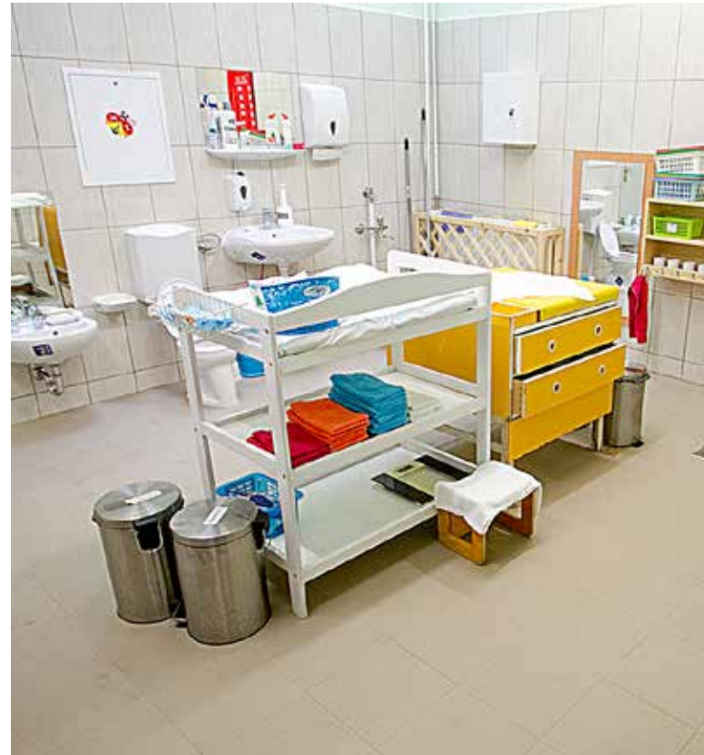
Korszerűsítették a vizesblokkokat is

A nyár végi határidőre elkészült a Bokréta bölcsőde korszerűsítése. Megújult a fűtési rendszer, kicserélték a burkolatokat, és két vizesblokk teljes felújítására is sor került.