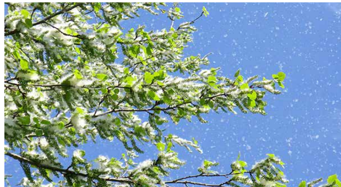
Szakmailag indokolatlan a nyárfák kivágása

Nem változott az önkormányzat Zöldprogram Irodájának évekkal ezelőtt megfogalmazott szakmai véleménye a kanadai nyárfákról annak ellenére, hogy a Fővárosi Közgyűlés kiadta az engedélyt azok teljes kivágására a főváros kezelésében álló zöldterületeken. A nyárfapamacs azon kívül, hogy idegesítő, nem allergén – állítják a szakemberek.