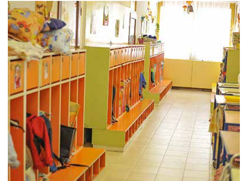
Kicserélték a közlekedők burkolatait is