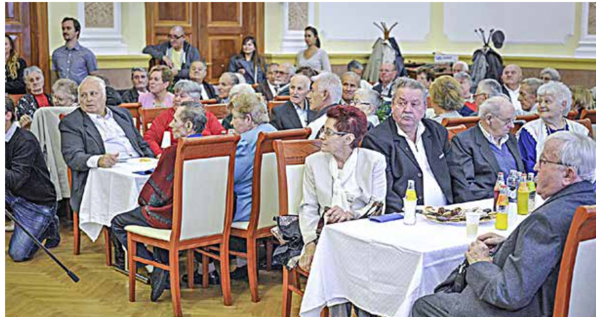
Idén rekordszámú pár jelentkezett az ünnepségre

Negyvenhat olyan kispeshti házaspárt köszöntöttek a Városházán, akik már 50 éve vagy még annál is régebben kötöttek házasságot.