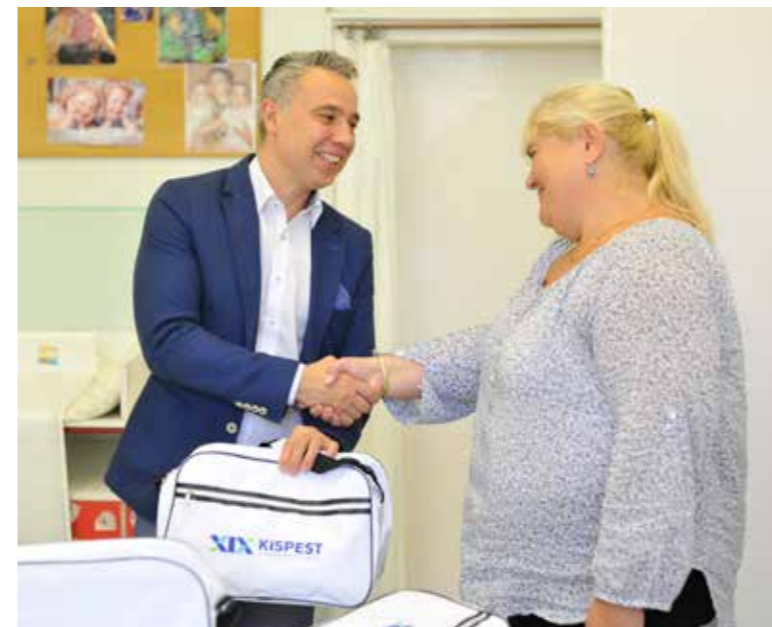
Idén 550 csomagot osztanak ki a védőnők

Babacsomagot kapnak ajándékba a várandós kerületi kismamák és az idén született kisgyermekek szülei az önkormányzattól: a táskákat a védőnők osztják ki.