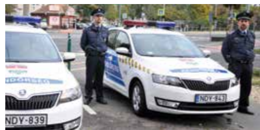
Eszközvásárlással támogatjuk a rendőroket

Kispest Önkormányzata átfogó, kiegyensúlyozott és intenzív kapcsolatot tart a kerületben működő rendvédelmi szervekkel, elsősorban a Kispesti Rendőrkapitánysággal. Közös célunk, hogy Kispest biztonságos városrésze lehessen a fővárosnak. Ennek érdekében az elmúlt években eszközvásárlással, rendőrautók beszerzésével, elismerési rendszerrel, anyagi juttatással támogattuk a kerület rendőreit. Fontos számunkra a Kispesti Polgárőrség támogatása is. Nemcsak új autó beszerzésével, hanem a járőrözés támogatásával anyagi segítséggel is hozzájárultunk ahhoz, hogy az önszerveződő kispesti civilek is teheszenek a kerület rendjéért, biztonságáért. Talán ennek köszönhető, hogy a Belügyminisztérium statisztikái szerint Budapest egyik legbiztonságosabb kerületévé vált Kispest.