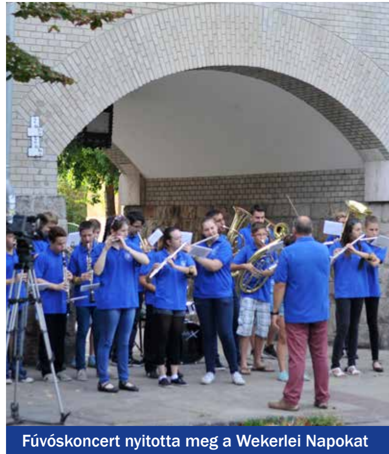
Fúvóskonzert nyitotta meg a Wekerlei Napokat

A XXV. Wekerlei Napokat rendezte meg az önkormányzat és más partnerek támogatásával, önkéntesek segítségével a Wekerlei Társaskör Egyesület szeptember harmadik hétfőjén.