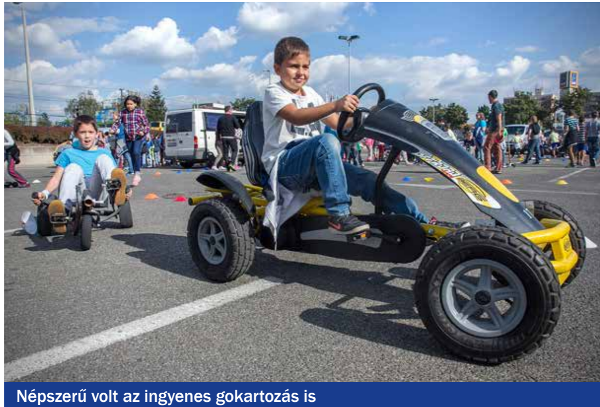
Népszerű volt az ingyenes gokartozás is

Bringás reggeli az Europark előtt, délután pedig ügyességi és ökojátékok, kézműves foglalkozások és még sok érdekes, környezetbarát program várta a kispestieket szeptember 22-én, az Autómentes Napon.