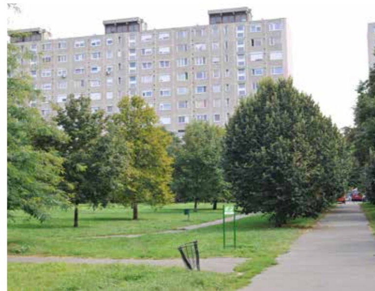
Több fórumot is tartanak a terület megújításáról

Az önkormányzat kezdeményezésére, a környéken élők többfordulós ötletelésével és véleményezésével, úgynevezett közösségi tervezéssel készült majd el a Kosárfonó utca–Vak Bottyán utca–Eötvös utca által határolt terület, az egykori KRESZ-park felújításáról szóló koncepcióterv.