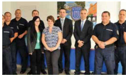
Több rendész védi a közterületeket és a kerületben élóket

Javaslatomra 2014-ben a kispesti képviselő-testület létrehozta a Kispesti Rendészeti Központot. Azzal a céllal alakítottuk meg a kerület saját rendvédelmi szervét, hogy támogassuk a rendőrség munkáját, és a kerület biztonságosabb, rendezettebb városrésze lehessen a fővárosnak. Elsősorban a közterületek rendje ellen elkövetett szabálysértésekkel, illegális hulladékkihelyezéssel, kisebb súlyú bűncselekményekkel foglalkoznak a közterületfelügyelők és a Rendészeti Központ munkatársai. Az a célunk, hogy működésüknek köszönhetően a kerület rendezettebb, tisztább és biztonságosabb legyen. Éppen ezért azt tervezzük, hogy a következő évben újabb közterületfelügyelők, rendészek állnak munkába. Reményeink szerint a megnövelt járőrállománynak köszönhetően tovább javul az itt élők biztonságérzete.