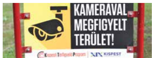
Folytatjuk a kamerák telepítését!