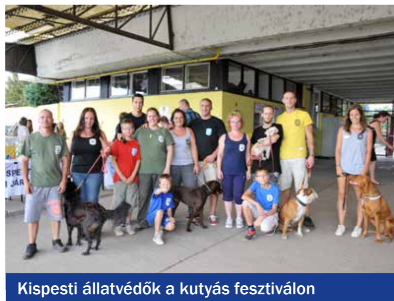
Kispesti állatvédők a kutyás fesztiválon