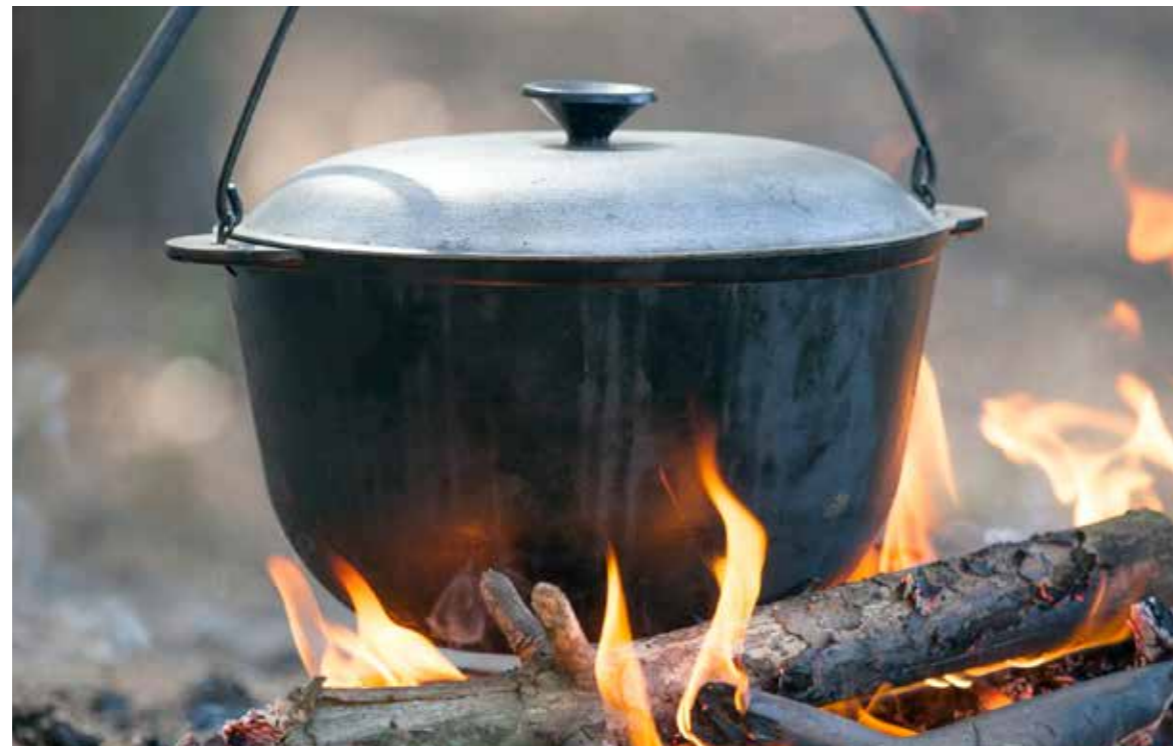
Kerti grillezés és bográcsozás közben állandóan felügyelni kell a tüzet

A szabadtéri tüzek megelőzése érdekében ismerni kell a biztonságos szabadtéri tűzgyújtás és a tüzmelegítés alapvető szabályait – hívja fel a figyelmet tájékoztatójában a Fővárosi Katasztrófavédelmi Igazgatóság.