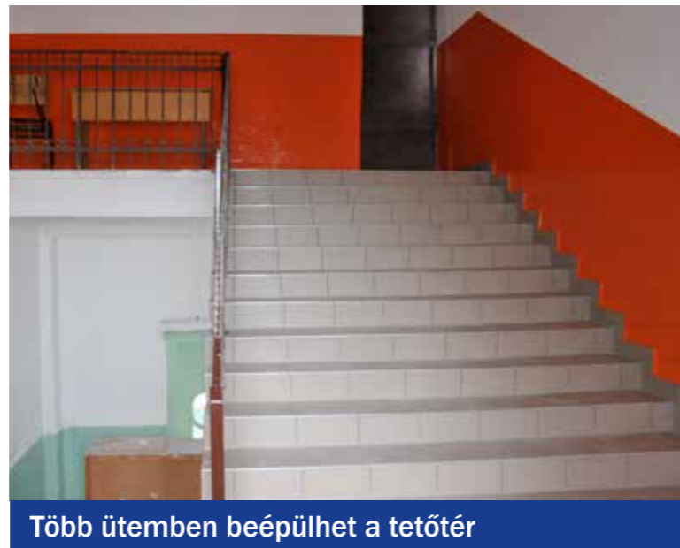
Több ütemben beépülhet a tetőtér

keskeny lépcsőből vasbeton szerkezetű lépcsőházat építettek. Újraakolták és lefestették a lépcsőház belső falfelületét, lábazzal együtt új burkolatot kaptak a járófelületek, javították a meglévő műköburkolatokat, és 12 új fénycsőes lámpatesttel felújították a lépcsőház elektromos hálózatát. Idén az Erkel iskolában folytatódik az intézmények felújítása, az iskolai világításkorszerűsítési programban korábban teljesen megújult a Bolyai iskola, valamint a Gábor iskola tantermeinek és folyosóinak, az Eötvös, a Puskás és a Vass iskolák tantermeinek világítása.