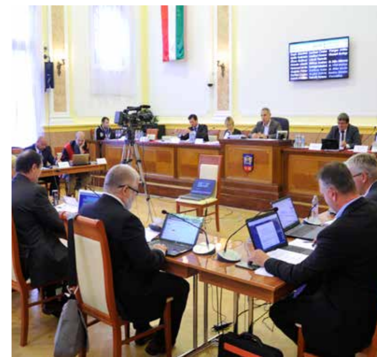
Csaknem félszáz napirendi pontról tárgyaltak