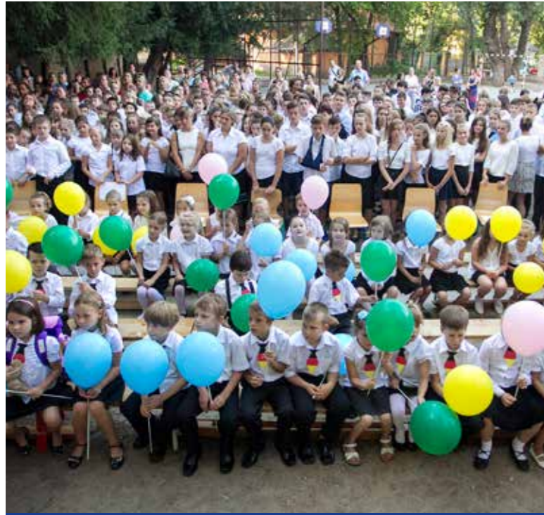
Kerületi tanévnyitó ünnepség az Erkel iskolában

Idén az Erkel iskola tanévnyitó ünnepségével indult el a 2016/2017-es tanév Kispesten. Az önkormányzat az iskolák államosítása után is elvégzi a korábban megígért felújításokat.