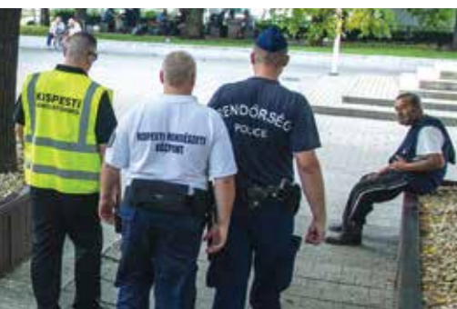
Megvédjük a közösségi vagyont!

A kispesti képviselő-testület számára fontos az önkormányzati, közösségi vagyon védelme is. Ezért idén ősszel külsős szakmai szervezettel is szerződést kötöttem annak érdekében, hogy hatékonyabban védezhessük az önkormányzati vagyontárgyakat, közterületi eszközöket, játszotereket, zárt parkokat. A kerületőröknek elsősorban ez a feladatuk: éjjel és nappal is a helyszínen védik a legveszélyeztetettebb helyszokeket, a Kossuth teret, a Templom tér környékét, a kiemelt játszotereket, parkokat. A kerületőrök munkába állításával is támogatjuk a kerületi kapitányságot, velük szorosan együttműködve a jogszabályok betartását és betartatását erősítjük.