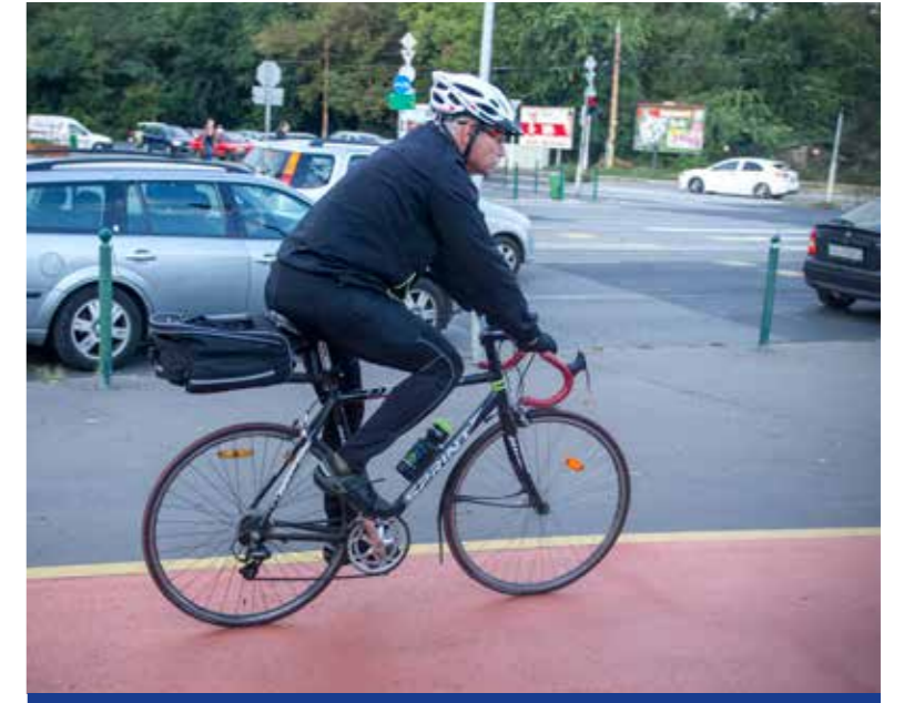
Folytatódhat a bringás infrastruktúra fejlesztése

dőíves felmérést készítettek a kerületben a kispestiek kerékpározási szokásairól, ennek eredményeire épülve és a BKK javaslatára készülnek a tervek a további fejlesztésekre.